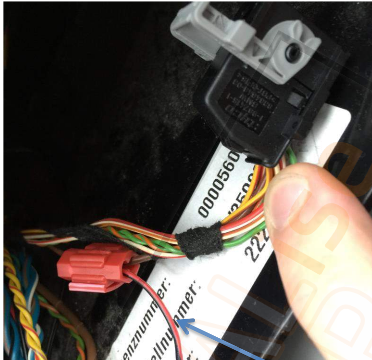
Schwarzes Kabel von dem Inverter